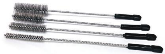
Furça me formë konike